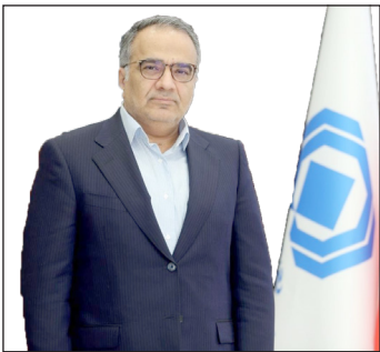
مجید بهزادپور رئیس کل بیمه مرکزی

مهار تورم و ایجاد امنیت روانی برای فعالان حوزه‌های گوناگون تلاش خواهیم کرد. سالروز تاسیس بیمه مرکزی، بر تمامی کسانی که شاعر رفاه عمومی و آرامش همگانی را بر لب دارند و برای استقرار نظام امن اقتصادی از پیش طعم شیرین خدمت‌خادمان خود را چشند،