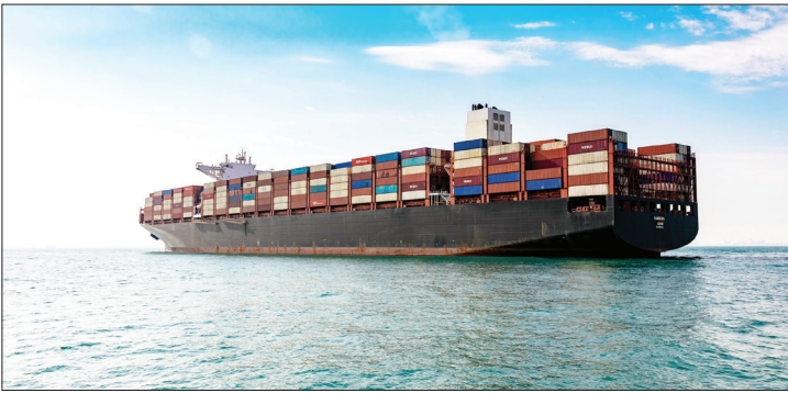
کشتی ایرانی در شمال آفریقا پهلو گرفت

همزمان با سفر رئیس جمهور به کشورهای آفریقایی، معاون کشتیرانی جمهوری اسلامی ایران با بیان اینکه علاوه بر تقویت خط منظم کشتیرانی جهت حمل بار صادراتی به مقصد شرق و شمال آفریقا که در گذشته راه‌اندازی شده بودند، اعلام کرد: کشتی حامل بار صادراتی ایران پس از از پهلوگیری، امروز بنادر شمال آفریقا را ترک کرد.