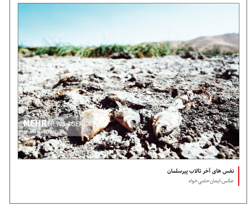
نفس های آخر تالاب پیرسلمان