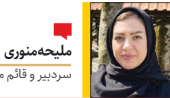
سردبیر و قائم مقام مدیرمسئول

مشاور رئیس سازمان غذا و دارو با بیان اینکه سالانه ۱۵ درصد شیرخشک‌های تولیدی قاچاق می‌شود گفت: در حال حاضر به طور متوسط روزانه ۲۵۰ هزار قوطی شیرخشک در حال توزیع است. این میزان از توزیع شیرخشک‌ها نسبت به سال گذشته ۱۵ درصد افزایش یافته است.