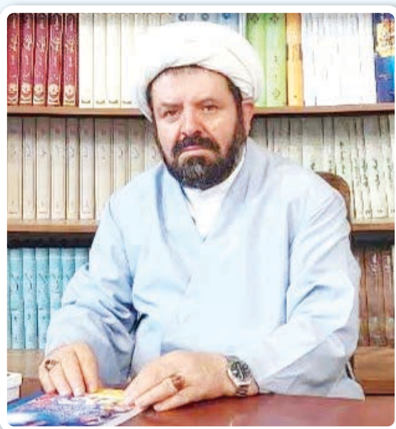
مقاله از: شیخ علی واشقانی فراهانی

این کتاب در چهار فصل تدوین یافته است که نگارنده آن در فصل نخست «جایگاه و نقش مسجد در اسلام» در هفت موضوع و در فصل دوم، به «سیمای مسجد حضرت امام رضا (ع)» در یازده مبحث می‌پردازد. فصل سوم با موضوع «مسجد امام رضا(ع) از دیدگاه مردم و نمازگزاران» و فصل چهارم درباره «جایگاه مسجد در آثار اهل هنر» است. به گزارش پایگاه تخصصی مسجد به نقل از عقیق مساجد از صدر اسلام می‌شدند و مهم‌ترین پایگاه‌های اجتماعی، سیاسی و فرهنگی شمرده به عنوان اهمیت آن به قدری بالا بود که پایهای تمدن اسلام از آنجا نهادینه شد. متأسفانه طی سالیان اخیر مساجد به دلایل متعددی کارکردهای اصلی خود را از دست داده‌اند و تنها به محلی برای اقامه نماز تبدیل شده‌اند. در این بین ائمه جماعتی هستند که به این تهدید توجه کرده‌اند و بر اساس رسالتی که بر عهده دارند، اقدامات مناسبی را در راستای احیای مساجد انجام داده‌اند و سعی کرده‌اند منویات مقام معظم رهبری را جامعه عمل بپوشانند. یکی از نکات مهمی که معظم له در دیدار اخیر ائمه جماعات اشاره داشتند، نگاشتن سرگذشت مساجد بود؛ ایشان در این دیدار اشاره داشتند: «مساجد ما یعنی مساجدی بی نیاز می‌دانند باشند که غیر از کتاب و غیر دروغ و تکنولوژی وجود دارد، و شبکه‌های مجازی که نباید فراموش کرد که صدای خودکار و ممد کم رنگ و مهمتر و بی‌همتای هر چیز دیگر است و مورد اعتماد، و شیرازه