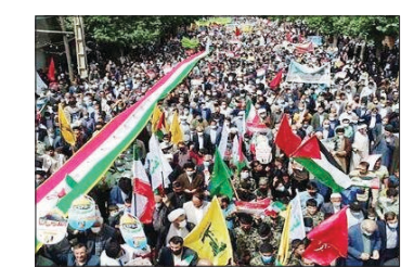
مردم فلسطین در حمایت از آزادی قدس شریف فریاد زدند.

ضمن محکومیت جنایات رژیم خون آشام صهیونیستی، خواستار اقدام عملی سازمان‌های بین‌المللی در توقف ماشین آدم‌کشی رژیم جعلی اسرائیل و محاکمه سران کودک‌کش این رژیم دیوسیرت شده و حمایت همه جانبه خود را از مردم فلسطین تا آزادی قدس شریف فریاد زدند.