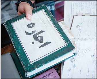
فوق‌الذکر با خطیان و متخلفان طبق ضوابط و مقررات برخورد خواهد شد.

ذاکری اتفاقات مطلوب در حوزه فناوری و تکنولوژی سازمان را یادآور شد و افزود: مسیر بومی‌سازی سامانه‌های نوین با همراهی