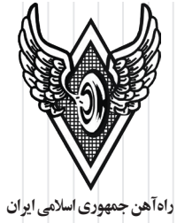
راه‌آهن جمهوری اسلامی ایران