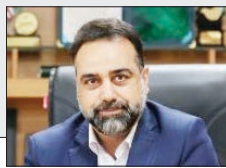
مدیرکل فرودگاه‌های استان فارس:

عملیات اجرایی پروژه بهسازی سطوح پروازی فرودگاه داراب سرعت گرفت