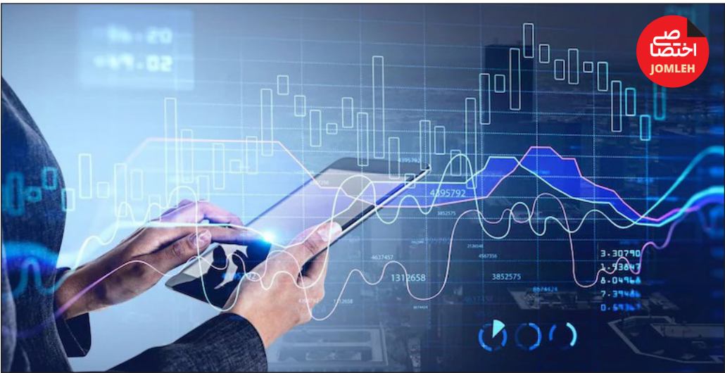
تداوم رشد بازار سرمایه در ایران

قیمت سهام اغلب شرکت‌ها به کف رسیده و احتمال ریزش کمتری دارند. دیروز کاهش نرخ سود اوراق خزانه اسلامی نیز در رشد تقاضا در بازار سهام موثر بود. اما ناظران سیگنال‌های مثبت دولتی‌ها را نیز در رشد بازار سهمی می‌دانند. احسان خاندوزی، وزیر اقتصاد و سخنگوی اقتصادی دولت در نشست خبری گفته بود: «نارضایتی‌های زیادی اخیراً نسبت به بازار سرمایه وجود داشته است. صبح امروز ستاد هماهنگی اقتصادی برگزار شد و پیشنهادات برای کمک به چشم انداز سودآوری بورس مطرح شد. ۴ تصمیم اتخاذ کردیم که اولین تصمیم کنترل قانونی نرخ سود بانکی است. قرار بر این شد رئیس بانک مرکزی نظارت بیشتری روی این موضوع داشته باشند. سازمان برنامه و بودجه موظف شد که بار مالی معافیت‌های مالیاتی را بپذیرد. بنابراین شرکت‌های بورسی در سال ۱۴۰۳ معافیت خواهند داشت.» همچنین خاندوزی گفت: «دکتر مخیر دستور دادند که مسئله نرخ خوراک پالایشگاه‌ها که تأثیر زیادی روی سودآوری شرکت‌ها دارد، بررسی شود.» بنابراین می‌توان گفت دولتی‌ها قصد داشتند به بازار سیگنال مثبت دهند و بازار نیز این سیگنال را دریافت کرده است اما تداوم رشد بازار به عملیاتی شدن وعده‌های دولت بستگی دارد. ارزش معاملات در سطح پائینی قرار دارد و معامله‌گران به اقدامات عملی در جهت سیاست‌گذاری صحیح و بازار محور دولت نیاز دارند.