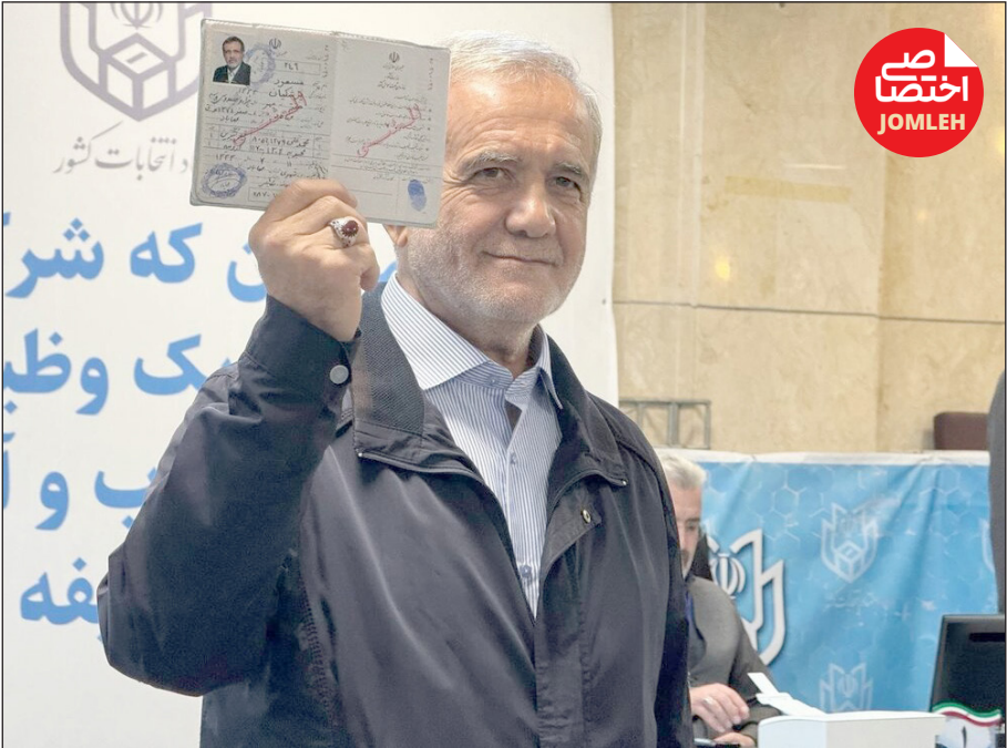
اختصاصی جمله گروه سیاسی

اگر شورای نگهبان به سیاق انتخابات سیزدهمین دوره ریاست جمهوری رفتار کند، فرصت مهم مشارکت مردم را می گیرد و چه بسا انتخاباتی خلوت تر از میان دوره های مجلس که ۲۱ اردیبهشت گذشته، برگزار شد را شاهد خواهیم بود اما اگر شورای نگهبان در روش پیشین خود تجدینظر کند و نیروهایی که در همین کشور و امروز مسئولیت دارند را تأیید صلاحیت کند، می توان امیدوار بود در ۸ تیرماه انتخاباتی چون سال ۹۲ و ۹۶ برگزار شود