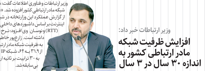
عکس وزیر ارتباطات و فناوری اطلاعات در حال سخنرانی.