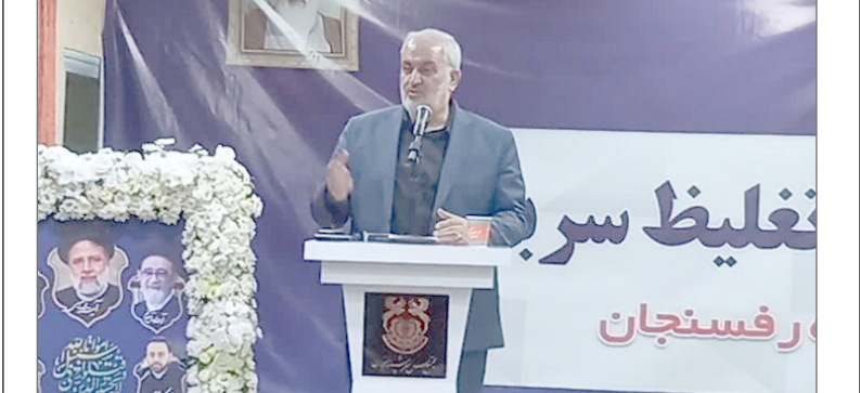
عکس وزیر صمت در حال سخنرانی در یک رویداد تخصصی.

وزیر صنعت، معدن و تجارت گفت: باید با استفاده از دانش بنیان و فناوری روز دنیا صنعت مس را توسعه بدیم تا بتواند رقابت کند و ماندگار شود. عباس علی آبادی در آیین افتتاح کارخانه تغلیظ سرباره مس سرچشمه افزود: امروز هر کس دانشمندتر و فهم بیشتری از مهندسی داشته باشد ماندگاتر است، بنابراین باید با استفاده از دانش و فناوری روز دنیا صنعت مس را توسعه داد و قیمت‌ها را رقابتی و ارزان کرد. وی تصریح کرد: صنعت مس برای خام فروشی ایجاد نشده است ما از شما مهندسان انتظار متفاوت داریم و باید صنعت مس را بر اساس محور دانش بنیان توسعه و صادرات آن را افزایش داد.