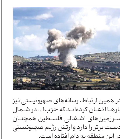
در همین ارتباط، رسانه‌های صهیونیستی نیز بارها اذعان کرده‌اند که حزب... در شمال سرزمین‌های اشغالی فلسطین همچنان دست برتر را دارد و ارتش رژیم صهیونیستی در این منطقه به دام افتاده است.

حزب... لبنان اعلام کرد که تجهیزات جاسوسی دشمن صهیونیست را در شمال فلسطین اشغالی هدف قرار داده است. به گزارش خبرگزاری مهر به نقل از المیادین، مقاومت اسلامی لبنان در بیانیه‌ای اعلام کرد: رزمندگان ما، تجهیزات جاسوسی مرکز مسکاف عام در شمال فلسطین اشغالی را با سلاح مناسب هدف قرار دادند. منابع خبری از پراختن دود از مسکاف عام به دنبال حمله موشکی مقاومت اسلامی لبنان خبر دادند. از سوی دیگر رسانه‌های رژیم صهیونیستی از آتش سوزی در الجلیل علیا در شمال فلسطین اشغالی خبر دادند که به دنبال حملات موشکی از لبنان رخ داده است.