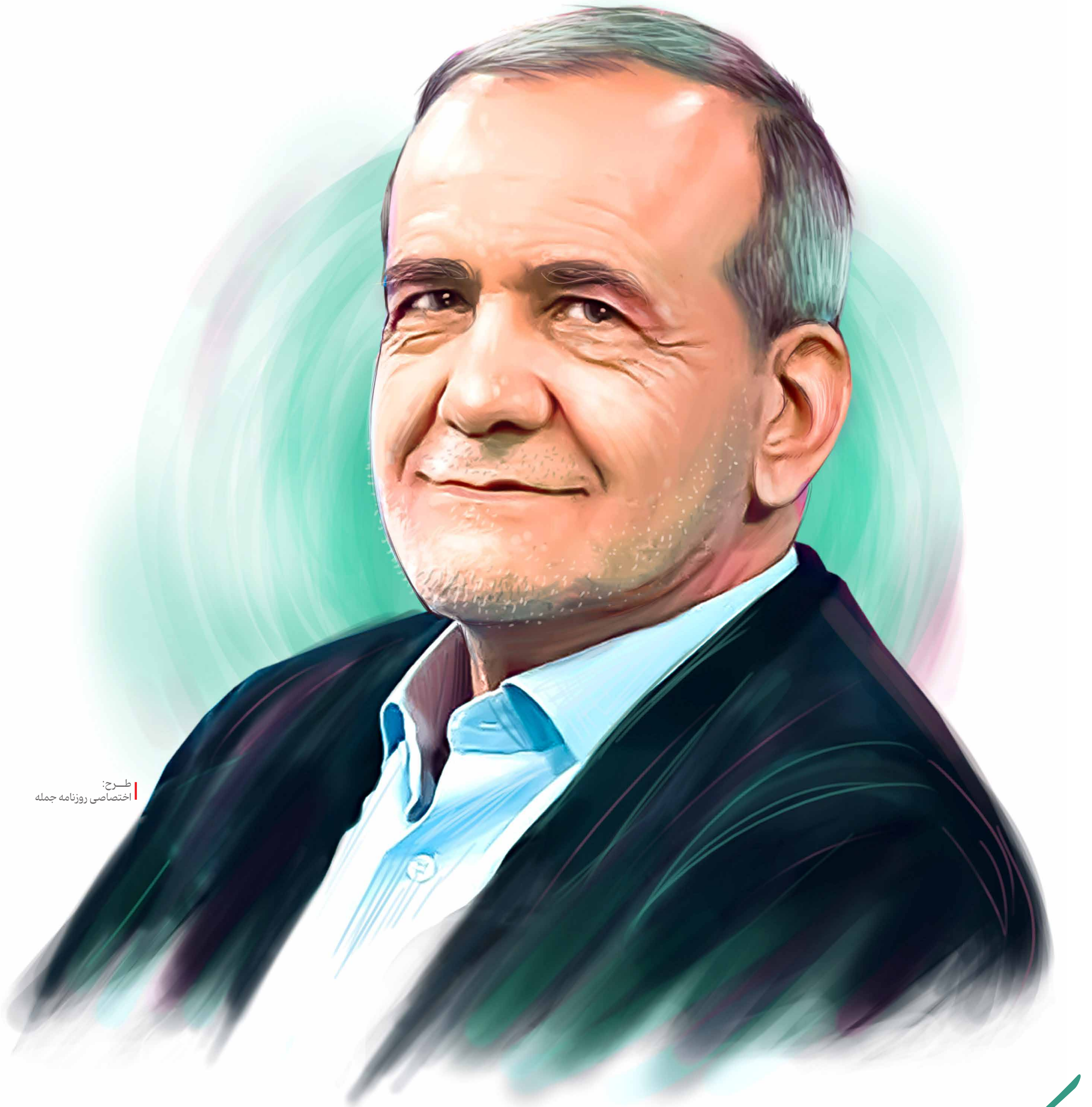
طرح: اختصاصی روزنامه جمله