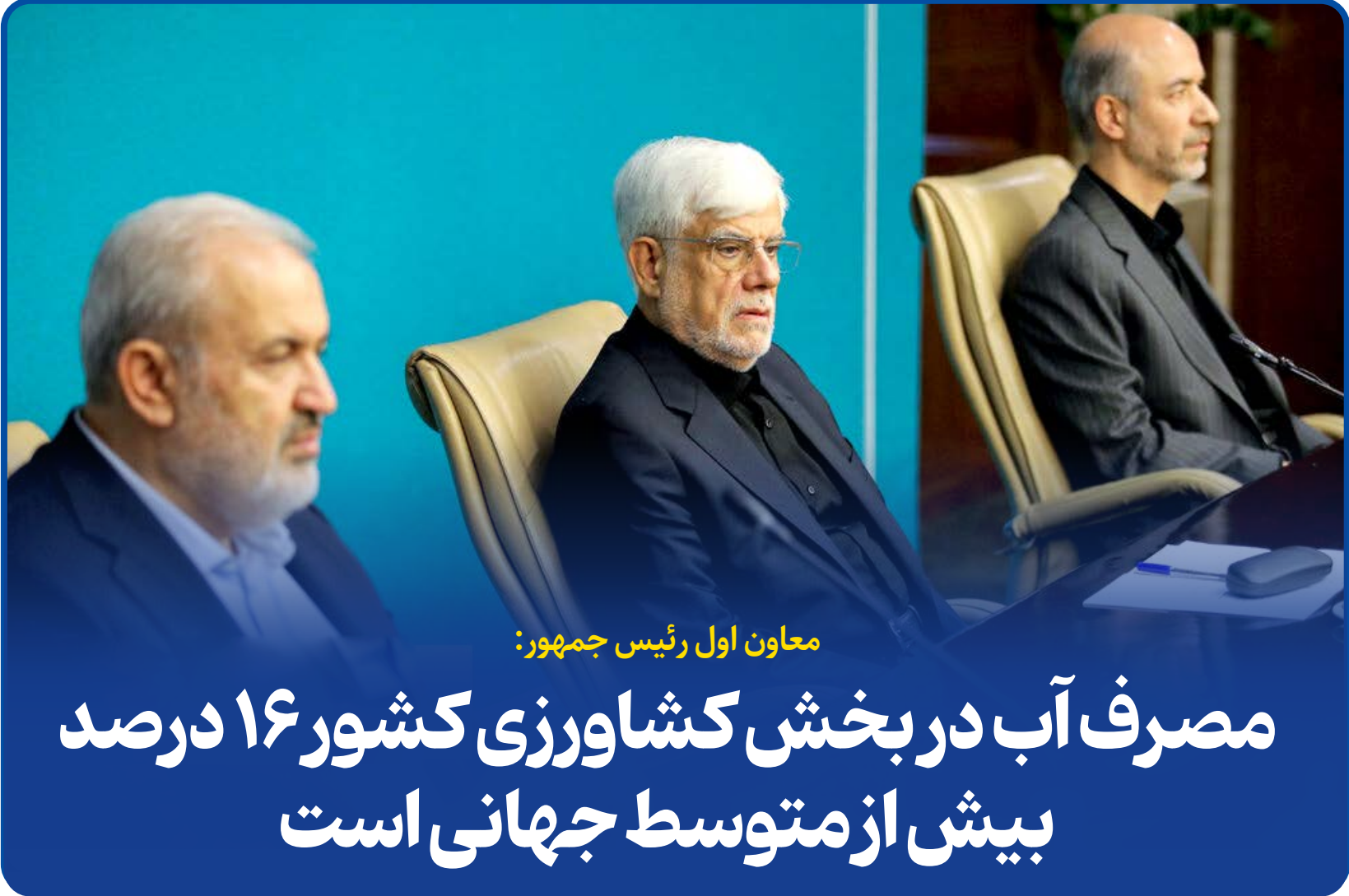
معاون اول رئیس جمهور: