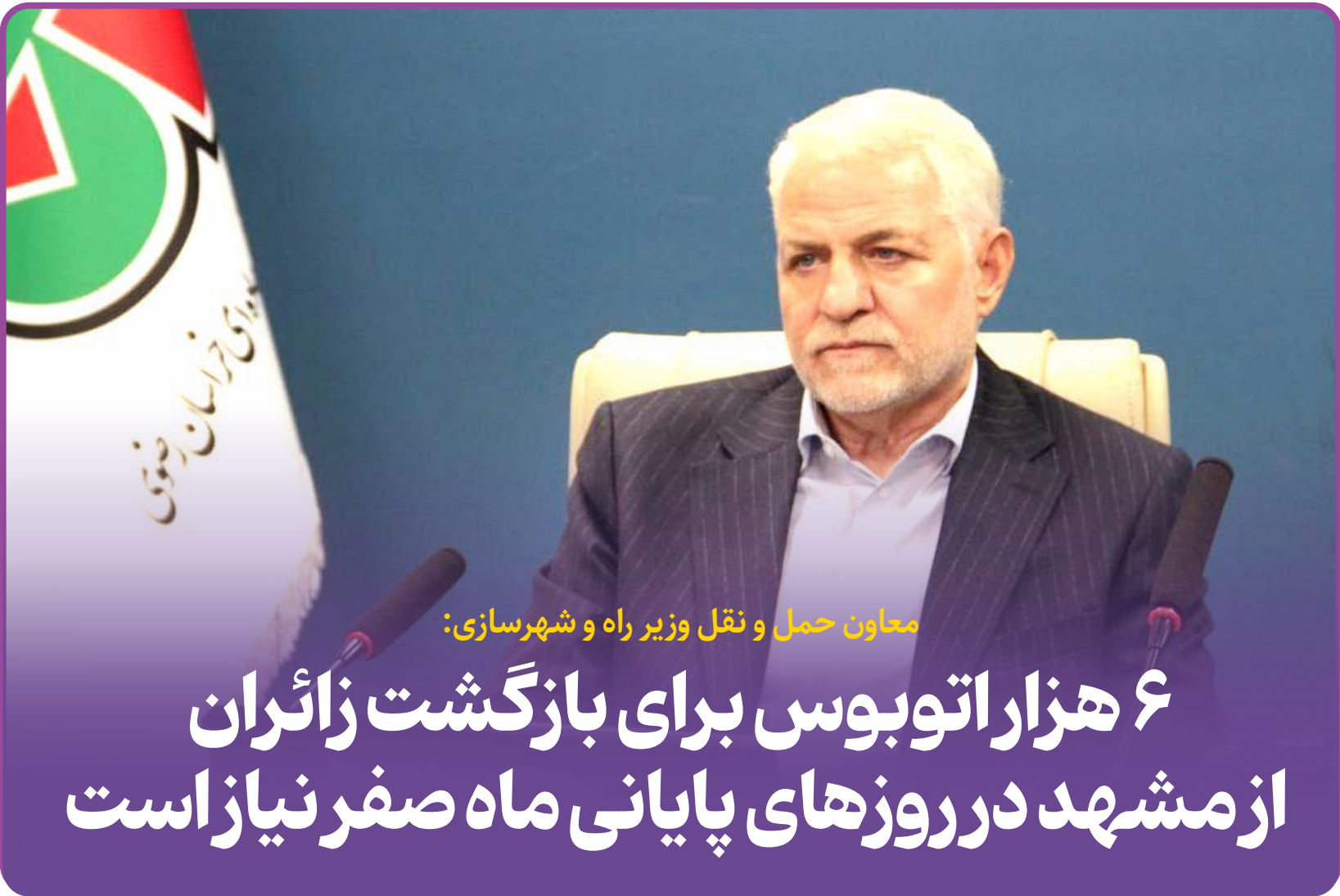
معاون حمل و نقل وزیر راه و شهرسازی؛