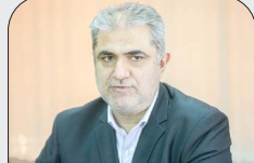
مدیرعامل سازمان مجری ساختمان ها و تاسیسات عمومی و دولتی تاکید کرد؛

واردات ۸۰۰ دستگاه ماشین آلات توان راهداری کشور را افزایش می دهد