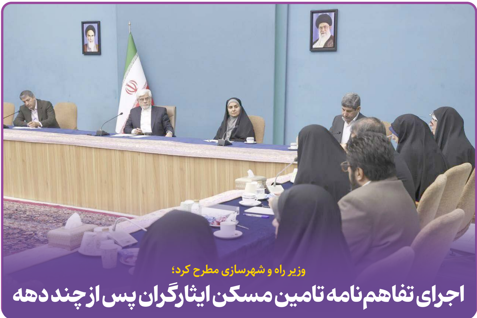
وزیر راه و شهرسازی مطرح کرد؛