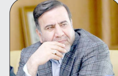
رئیس سازمان راهداری و حمل و نقل جاده ای:

واردات ۸۰۰ دستگاه ماشین آلات توان راهداری کشور را افزایش می دهد