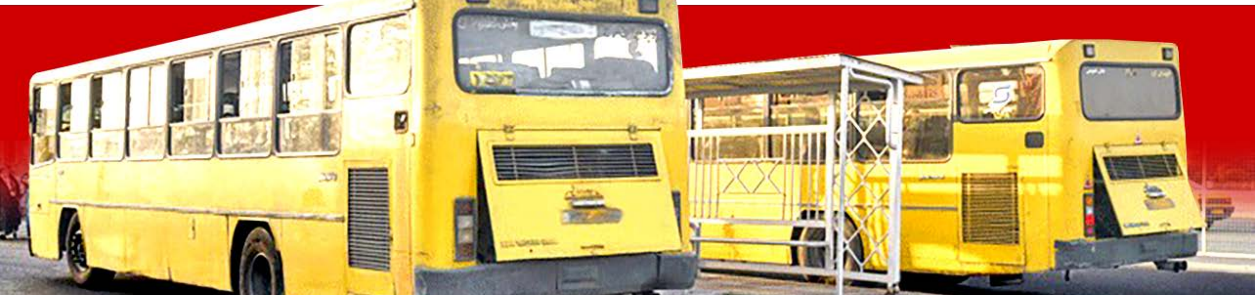
گزارش جمله از وضعیت حاد ناوگان حمل‌ونقل عمومی پایتخت و فرسودگی خطرناک آن؛