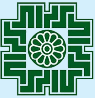
سازمان امور مالیاتی کشور

سازمان امور مالیاتی کشور اعلام کرد: ۳۰ مهرماه، آخرین مهلت برگشت ارز حاصل از صادرات هر پروانه صادراتی سال ۱۴۰۲ می باشد. به گزارش رسانه مالیاتی ایران، بر اساس اطلاعیه سازمان امور مالیاتی کشور، مطابق مصوبات بیست و دومین جلسه کارگروه بازگشت ارز حاصل از صادرات، با توجه به پایان مهلت ایفای تعهدات ارزی حاصل از صادرات سال ۱۴۰۲ در پایان روز ۳۱ تیرماه ۱۴۰۳، مهلت برگشت ارز حاصل از صادرات هر پروانه صادراتی سال ۱۴۰۲ به مدت ۳ ماه (حداکثر تا پایان روز سی ام مهرماه ۱۴۰۳) با رعایت مهلت قانونی ۱۵ ماه با بهره مندی از معافیت مالیاتی تمدید شده بود. بر اساس این اطلاعیه، مهلت بازگشت ارز حاصل از صادرات سال ۱۴۰۲ تمدید نخواهد شد و پس از پایان مهلت زمانی یادشده، درصد رفع تعهد ارزی سال ۱۴۰۲ صادرکنندگان کالا جهت اعمال معافیت‌های مالیاتی، محاسبه خواهد شد.