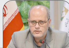
مدیرعامل شرکت عمران شهر جدید گلپهر خبر داد؛

خوستان رتبه دوم در تجارت دریایی کشور است