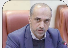
معاون امور دریایی سازمان بنادر و دریانوردی:

خوستان رتبه دوم در تجارت دریایی کشور است