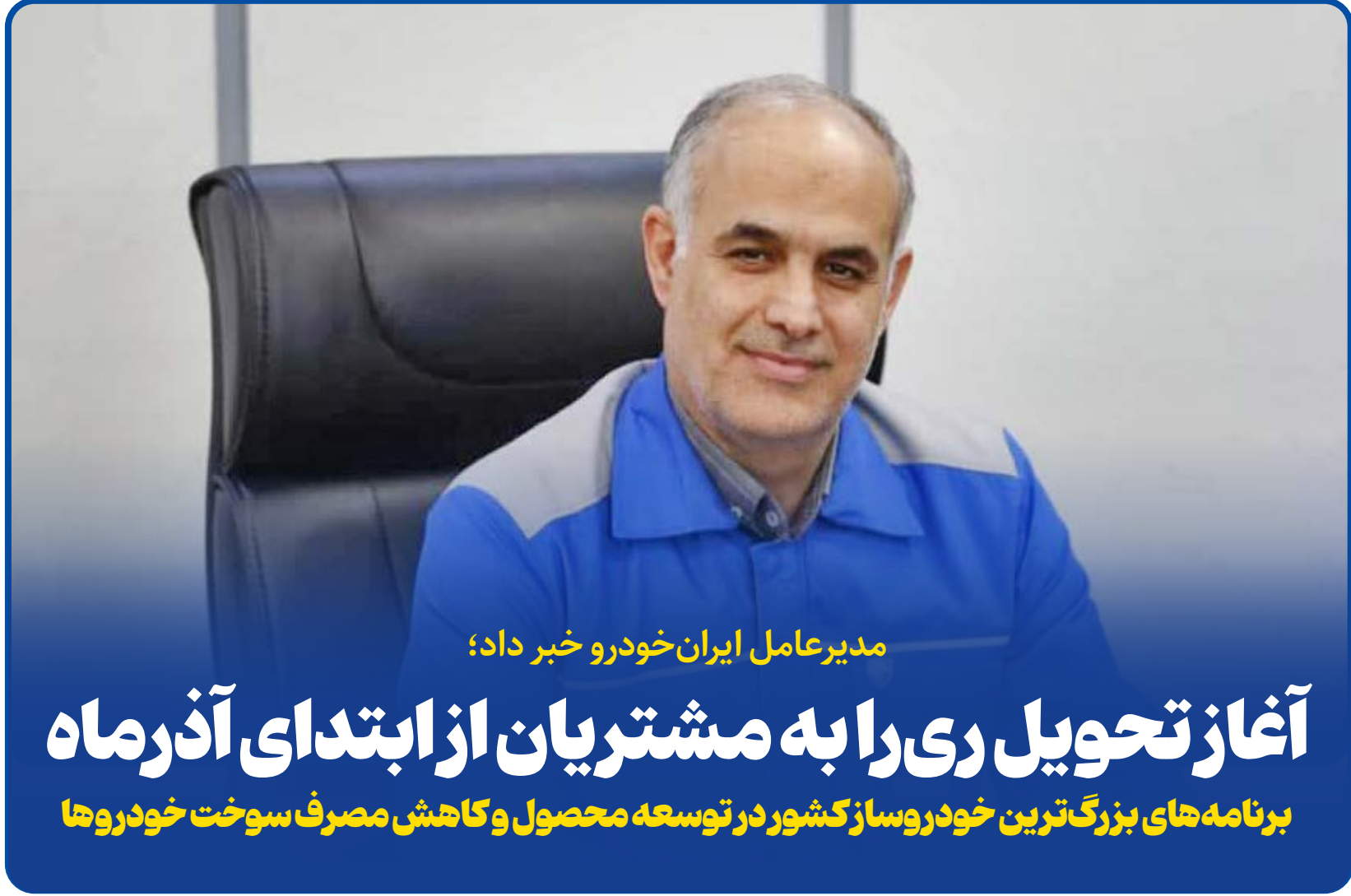
مدیرعامل ایران خودرو خبر داد؛