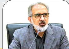
سرپرست بانک مسکن تأکید کرد؛

طراحی محصولات جدید برای جذب منابع قرض الحسنه