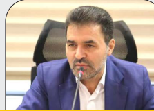
مدیرعامل صندوق ذخیره فرهنگیان خبر داد؛

بسترسازی برای سودآوری پایدار، مستمر و با کیفیت در صندوق