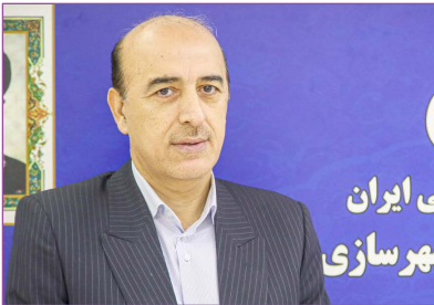
جمهوری اسلامی ایران وزارت راه و شهرسازی