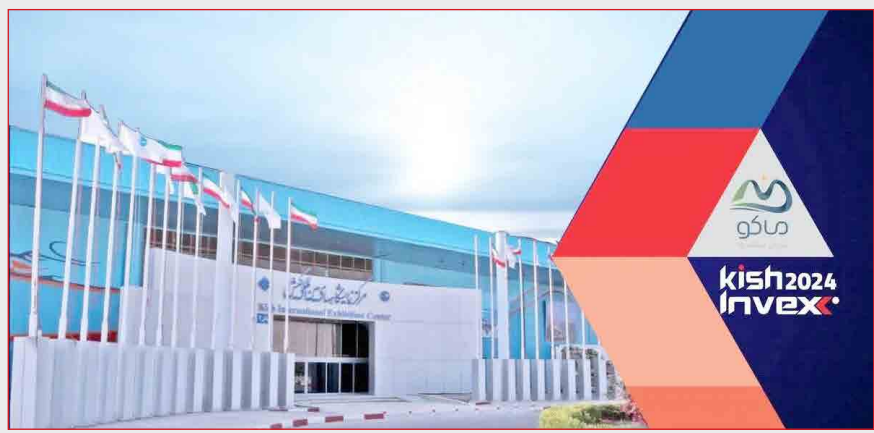
تبدیل کرده است. رویداد کیش اینوکس در سال " جهش تولید با مشارکت مردم " و با محور هایی نظیر هدایت نقدینگی به بخش‌های مولد اقتصادی، بررسی سیاست‌های کنترل رشد نقدینگی و مهار تورم، بهره

گیری از شیوه‌های نوین تأمین مالی، نقش بانک‌ها در جهش تولید از طریق تأمین مالی نگاه‌های اقتصادی، تمرکز بر اجرای دستورالعمل حاکمیت شرکتی، نقش بازار سرمایه در تحقق شعار سال، تأمین مالی و تقویت شرکت‌های دانش‌بنیان از