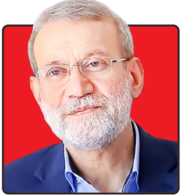
علی لاریجانی عضو مجمع تشخیص مصلحت نظام: