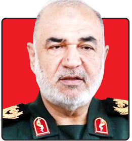
سردار سلامی فرمانده کل سپاه پاسداران انقلاب اسلامی: