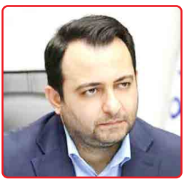
مدیرعامل بانک صادرات ایران در بازدید از شرکت سینا دارو تشریح کرد؛

سه‌شنبه ۲۲ آبان ۱۴۰۳ | ۱۰ جمادی الاخری ۱۴۲۴