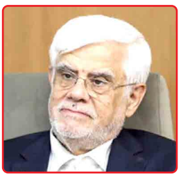
عارف در نشست اضطراری سازمان همکاری اسلامی و اتحادیه عرب پیشنهاد داد؛