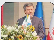
مدیرعامل بیمه ایران:

نظرآتمان با رئیس کل بانک مرکزی به هم نزدیک شده است