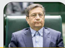
وزیر امور اقتصادی و دارایی:

نظرآتمان با رئیس کل بانک مرکزی به هم نزدیک شده است