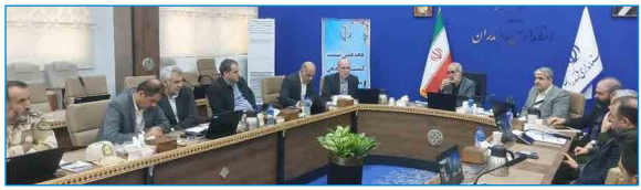
نشست کمیته ساماندهی و مدیریت سواحل استان مازندران

در این نشست همچنین، استاندار مازندران نیز بر ضرورت تلاش همه جانبه مسئولان ذیربط، برای اجرایی شدن طرح مطالعات یکپارچه مناطق ساحلی استان (ICZM) تاکید کرد.