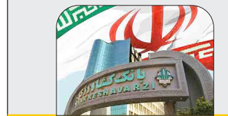
با اعطای ۱۸ هزار میلیارد ریال تسهیلات توسط بانک کشاورزی انجام شد؛

افزایش حمایت‌های تسهیلاتی بانک رفاه از کمیته امام خمینی (ره)