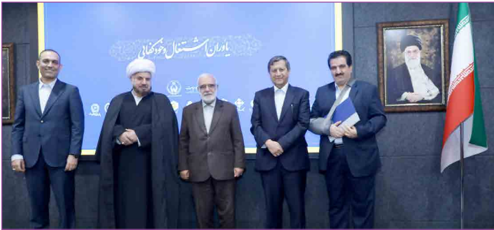
مدیرعامل شرکت عمران شهرهای جدید در جلسه شورای تهیه یک سند چشم انداز

برای تعیین برنامه زمانبندی افتتاح‌ها را امری ضروری دانست و تأکید کرد که این سند باید هرچه زودتر آماده و در برنامه اجرایی تمامی شهرها قرار بگیرد.