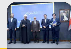
مدیرعامل بانک رفاه کارگران خبر داد:

افزایش حمایت‌های تسهیلاتی بانک رفاه از کمیته امام خمینی (ره)