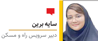
دبیر سرویس راه و مسکن