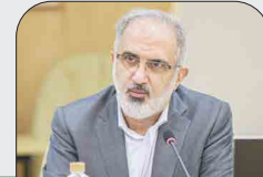
با حکم وزیر امور اقتصادی و دارایی؛

سرمایه گذاران در بافت های فرسوده مشمول معافیت مالیاتی می شوند