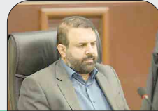
مدیرکل راه و شهرسازی استان تهران:

سرمایه گذاران در بافت های فرسوده مشمول معافیت مالیاتی می شوند