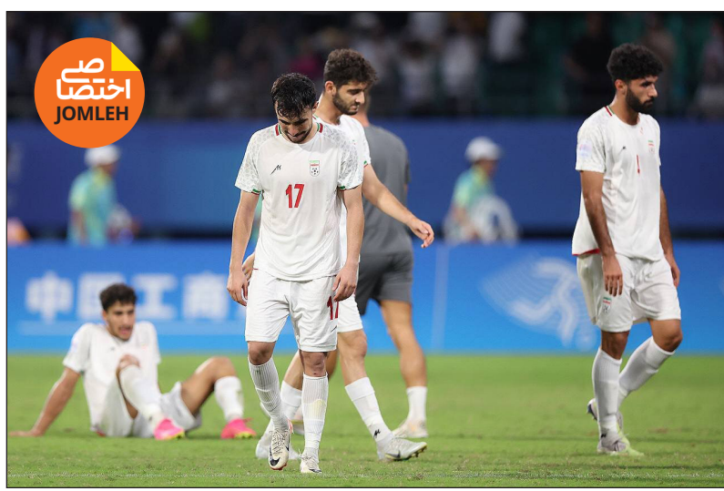
ایران به اصلاحات عمیق نیاز دارد.

آخرین تجربه تیم امید ایران تحت هدایت رضا عنایتی نشان داد که تغییر سرمربی، بدون برنامه‌ریزی دقیق، راهگشا نخواهد بود. پس از نیمه‌کاره رها شدن پروژه مهدی مهدوی‌کیا، عنایتی در شرایطی دشوار هدایت تیم را برعهده گرفت. او نه تنها نتوانست تیم را به مرحله نهایی مقدماتی المپیک ۲۰۲۴ پاریس برساند، بلکه شکست‌های تلخی نیز تجربه کرد. این ناگامی بار دیگر نشان داد که فوتبال پایه