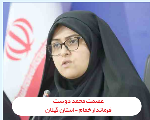
عصمت محمد دوست فرماندار خمam - استان گیلان