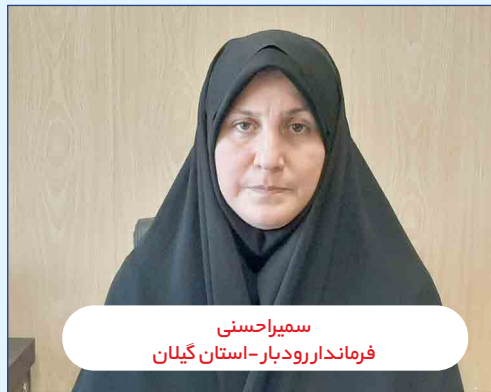
سمیرا حسینی فرماندار رودبار - استان گیلان

برای اولین بار است که در وزارت اقتصاد یک زن بر کرسی ریاست هیات نظار بانک مرکزی می‌نشیند. یوسفی تحصیل کرده دانشگاه نگراس در آستین است و هم‌اکنون استاد اقتصاد دانشکده مدیریت و اقتصاد شریف است. مسعود پزشکیان در ایام انتخابات، در بیانیه‌ای خطاب به زنان و دختران کشور اظهار کرده بود: «باور دارم که حضور زنان در سطوح بالای مدیریتی و تصمیم‌گیری، حق آنها و ضرورتی برای پیشرفت کشور است. هدف من افزایش سهم زنان در مناصب مدیریتی کشور بر اساس شایسته‌سالاری و عدالت است. من حق انتخاب شدن زنان در مناصب سیاسی را به رسمیت می‌شناسم و جایگاه امور زنان را در ساختار دولت ارتقا خواهم داد. من به رسمیت شناختن حق انتخاب شدن و تسری شمول رجل سیاسی به زنان را دوشادوش خودشان پیگیری می‌کنم.»