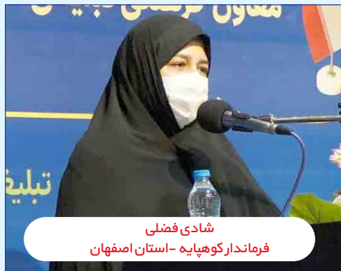
شادی فاضلی فرماندار کوهپایه - استان اصفهان