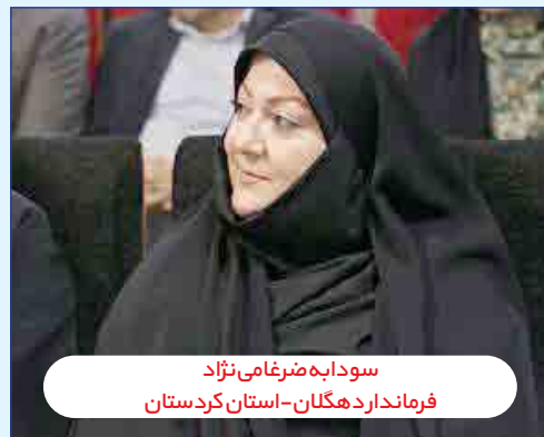
سودابه ضریغامی نژاد فرماندار دهگلان - استان کردستان