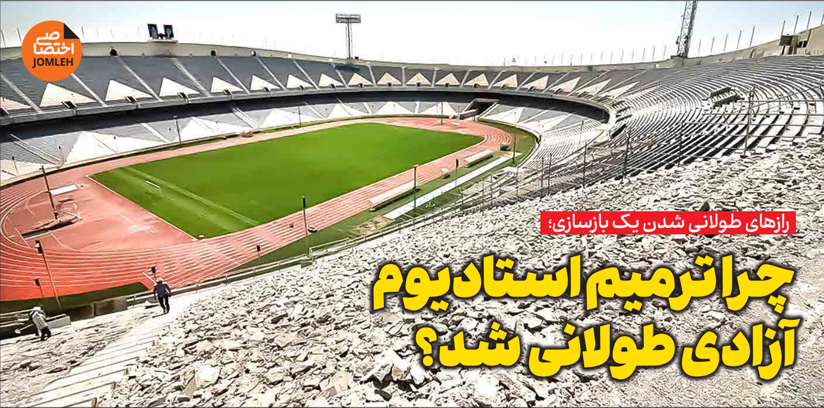
رازه‌های طولانی شدن یک بازسازی؛