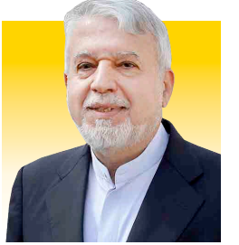
صالحی امیری، وزیر میراث فرهنگی گردشگری و صنایع دستی: