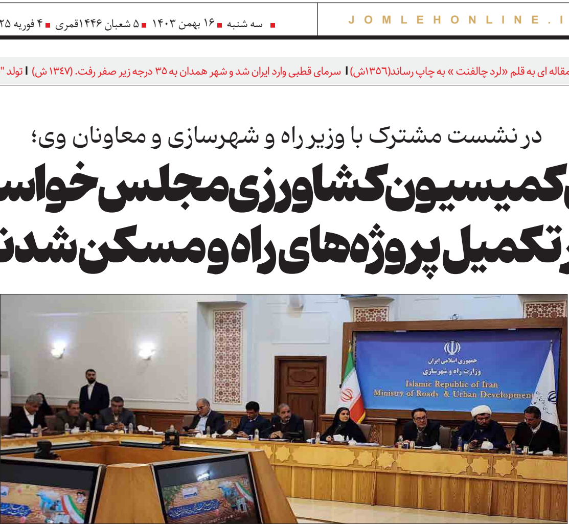
جلسه شورای راهبردی راه و مسکن

محرورم شازند در مرکز ابرار قرار دارد و آزادراهی که از شمال به اراک رسیده و از جنوب تا بروجرد آمده نیازمند تکمیل است.