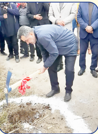
مهدی قاسمی - فرماندار محمود آباد