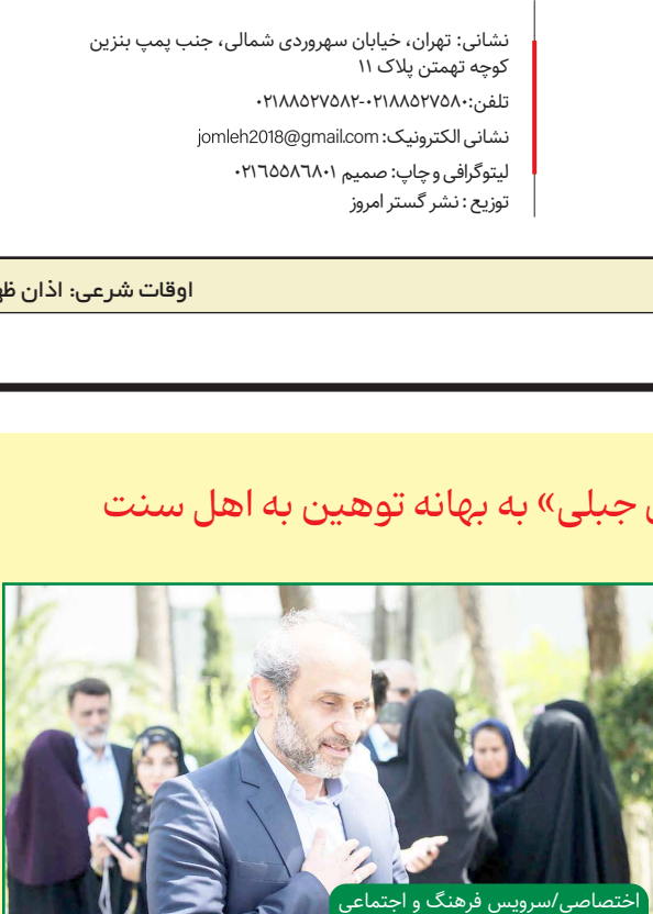
اختصاصی/سرویس فرهنگ و اجتماعی

رئیس اتحادیه طلا و جواهر تهران افزود: در بازارهای داخلی نیز روند کاهش قیمت‌ها را داشتیم که نسبتاً بالا بوده، هر گرم طلا ۱۸۰۰ عیار یا ۳۶۵ تومان کاهش در آخرین معاملات پایانی هفته به شش میلیون و ۴۹۹ تومان آخرین قیمت بود. در طول هفته در بازار سکه نیز کاهش نسبی خوبی را داشتیم. وی خاطر نشان کرد: سکه تمام طرح جدید در طول هفته پنج میلیون و ۶۰۰ هزار تومان کاهش داشته‌و در آخرین قیمت به ۷۱ میلیون و ۹۰۰ هزار تومان رسید. سکه تمام طرح قدیم با سه میلیون و ۶۰۰ هزار تومان کاهش آخرین قیمت آن ۶۸ میلیون و ۶۰۰ هزار تومان کاهش بود. نیم سکه با پنج میلیون و ۷۰۰ هزار تومان کاهش به ۴۲ میلیون و ۸۰۰ هزار تومان، ربع سکه با یک میلیون و ۸۰۰ هزار تومان کاهش به ۱۴ میلیون و ۷۰۰ هزار تومان و سکه یک گرمی پانک مرکزی هم در مجموع با ۴۰۰ هزار تومان کاهش قیمت در طول هفته، در آخرین قیمت به ۱۳ میلیون و ۳۰۰ هزار