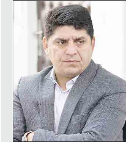
عبدالرضا گلباگیکانی معاون وزیر راه و شهرسازی

وی این نشست را مثبت و سازنده ارزیابی کرد و افزود: رویکرد حاضران در این نشست حل مسأله بوده و طرفین با نگاه مثبت و با هدف رفع مشکل در جلسه حاضر بودند.