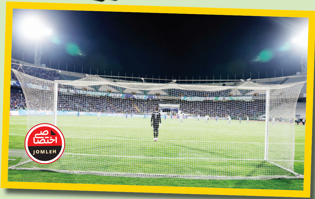
جمله ورزشی | اختصاصی

فصل بیست‌وپنجم لیگ برتر فوتبال ایران در شرایطی از بیست‌وهفتم مرداد آغاز خواهد شد که بحران استادیوم‌ها در کشور، به‌ویژه در پایتخت، به اوج خود رسیده است. تهران که در حالت عادی میزبان استقلال، پرسپولیس و پیکان است، حالا باید از دو تیم دیگر یعنی چادرملو اردکان و استقلال خوزستان نیز پذیرایی کند؛ آن هم در شرایطی که ورزشگاه آزادی از دسترس خارج شده و تنها دو استادیوم شهر قدس و تختی توانایی میزبانی محدود دارند. این یعنی پنج تیم در دو ورزشگاه! اتفاقی که نه تنها چالش‌های جدی برای سازمان لیگ در برنامه‌ریزی بازی‌ها ایجاد می‌کند، بلکه از هم‌اکنون زمینه نارضایتی هواداران، کادرفنی تیم‌ها و مدیران باشگاه‌ها را فراهم کرده است.