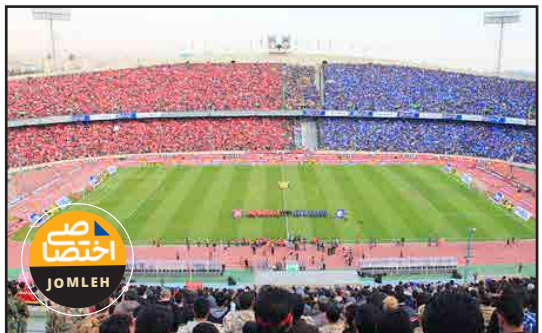
ورزشگاه آزادی در جریان بازی استقلال در مقابل پرسپولیس

فوتبال، ورزش، هیجان و فرهنگ است؛ نه ابزار تبلیغاتی برای نفع شخصی. بی‌عدالتی در تبلیغات، تضاد منافع و سوءاستفاده از زمان پخش، همه مصادیق قابل پیگیری هستند و نیازمند پاسخگویی فوری از سوی هلدینگ و صداوسیما هستند.