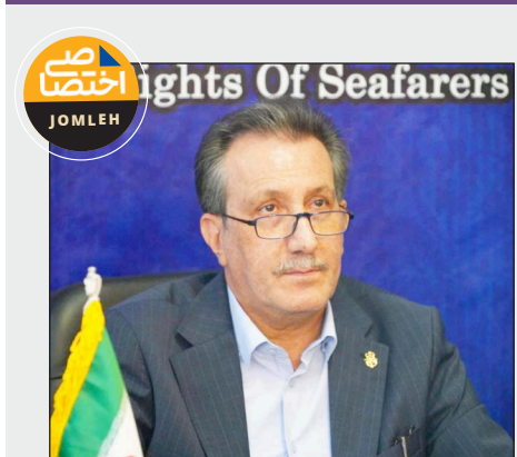
ights Of Seafarers JOMLEH

ارتباط زنده با دریانوردان روی عرشه از نکات جالب این دیدار، برقراری ارتباط تصویری با دو تن از اعضای هیات‌مدیره انجمن که در زمان برگزاری نشست در دریا و روی عرشه کشتی حضور داشتند، بود. این ارتباط زنده، نمادی از پیوند مستحکم میان دریانوردان و مدیریت عالی سازمان توصیف شد.