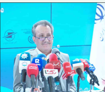
رکوردشکنی ترانزیت؛ عبور از هدف گذاری برنامه هفتم

مدیرعامل سازمان بنادر و دریانوردی با اشاره به جایگاه راهبردی ایران در نقشه حمل‌ونقل بین‌المللی، خاطرنشان کرد: ایران امروز به‌عنوان بازیگری فعال و اثرگذار در کریدورهای حمل‌ونقلی منطقه و فرامنطقه شناخته می‌شود؛ نقشی که می‌تواند موقعیت ترانزیتی ایران را در معادلات لجستیکی منطقه بیش از گذشته تثبیت کند.