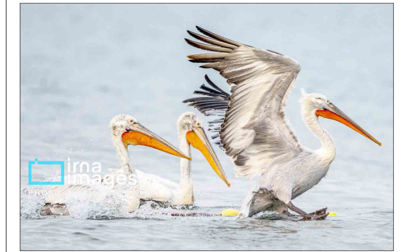
سواحل آرام مازندران هر ساله با آغاز فصل پاییز وزستان، شاهد بازگشت مهمانانی سفیدبال است؛ پلیکان‌هایی که پس از سفری طولانی، بر پهنه ی خزر فرود می‌آیند و چهره ی دریا را برای مدتی درگرم می‌کنند. عکس و متن: مهدی محبی پور / ایرنا