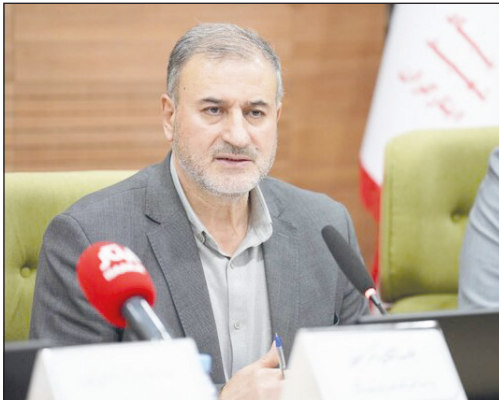
فرمانده انتظامی استان کردستان در جریان بازدید از کلاس آموزشی.