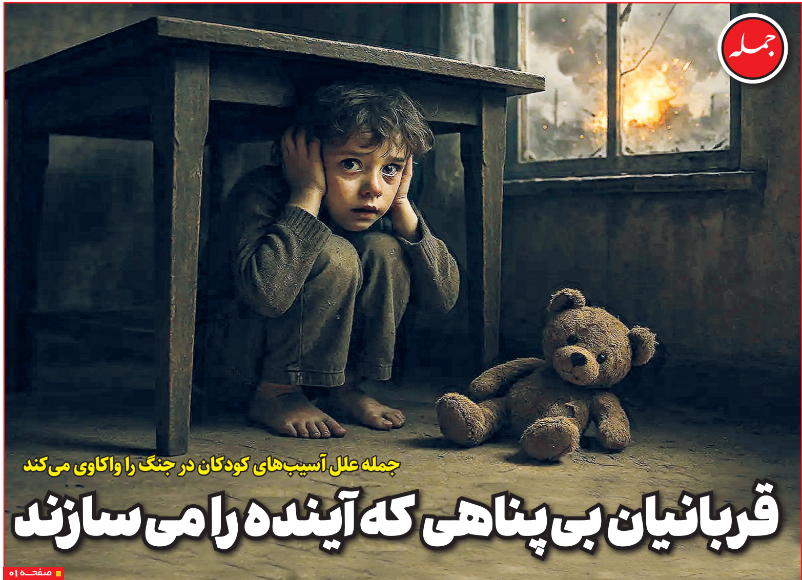
جمله علل آسیب‌های کودکان در جنگ را واکاوی می‌کند