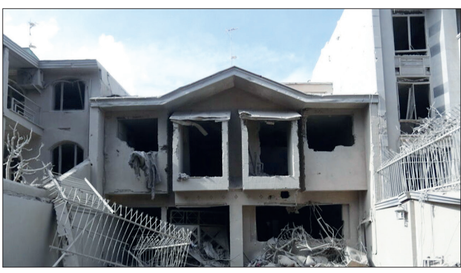
شده به لوازم معیشتی به ۱۶ هزار و ۳۶۵ واحد رسیده است.

در سایر شهرها و روستاها نیز ۷۵۷ واحد مسکونی تخریب شده و نیازمند بازسازی (احداثی) و ۴۸ هزار و ۷۲۹ واحد مسکونی نیازمند به تعمیر (تعمیری) شناسایی، ارزیابی و ثبت خسارت شده‌اند. در مجموع، تاکنون در ۲۴ استان ذکر شده تعداد واحدهای مسکونی احداثی به ۸۵۹ واحد و تعداد واحدهای مسکونی تعمیری به ۶۰ هزار و ۲۹ واحد رسیده است. براساس آخرین گزارش‌ها، به منظور تسریع و تسهیل فرآیند ارزیابی، بازسازی و جبران خسارت‌های وارد شده به واحدهای مسکونی، تجاری و اداری، ستادهای بازسازی بنیاد مسکن در استان‌ها تشکیل و تیم‌های ارزیابی مشخص و سازماندهی شده و فرآیند ارزیابی، شناسایی و ثبت خسارت‌های وارد شده به این واحدها به منظور جبران خسارت، با جدیت در حال پیگیری است. بنابراین گزارش، تاکنون پنج جلسه کشوری «پایش فرآیند اسکان و بازسازی مسکن» و چهار جلسه ستادی «کمیته ارزیابی خسارات و تدوین برنامه بازسازی مسکن» به میزبانی وزارت راه و شهرسازی، با حضور وزیر راه و شهرسازی، معاونان و مدیران کل این وزارتخانه در حوزه مسکن، مدیران بانک مسکن، مسئولان و مدیران بنیاد مسکن انقلاب اسلامی، رئیس هیات عامل صندوق ملی مسکن و ... با تأکید بر تسریع و تسهیل فرآیند ارزیابی و با هدف جبران خسارت‌های وارد شده، برگزار شده است.