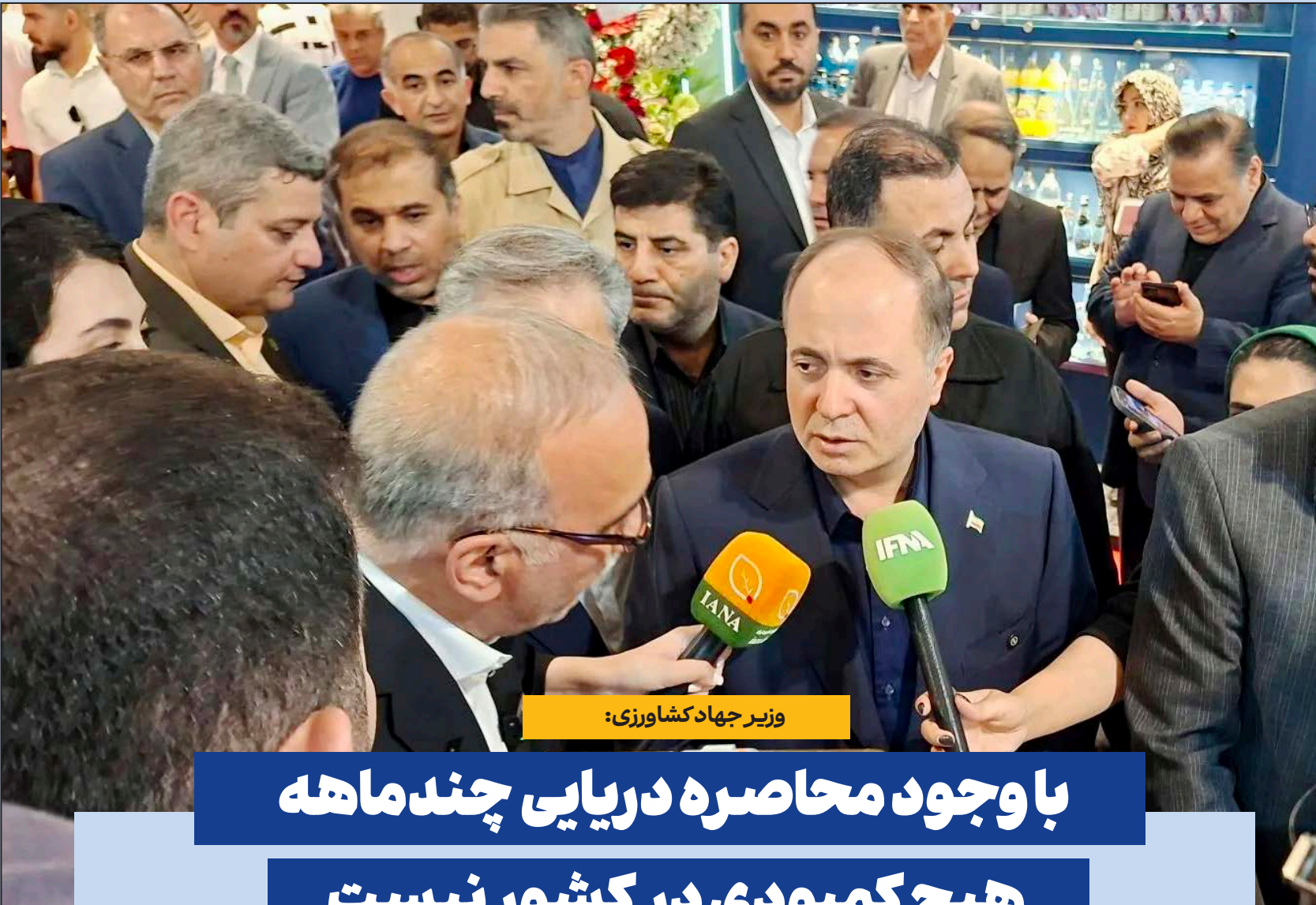
وزیر جهاد کشاورزی: