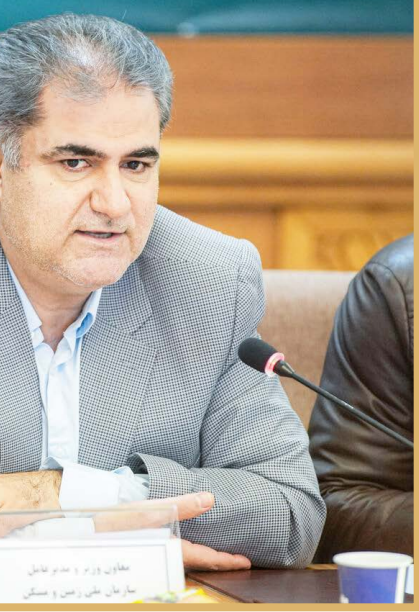
مهدي كربی، مدیرعامل سازمان ملی زمین و مسکن در نشست با اعضای هیات رئیسه سازمان

به گفته این مقام مسئول در مجموعه دولت چهاردهم، سازمان ملی زمین و مسکن در اجرای ماده ۱۰ قانون جهش تولید مسکن با موضوع اخذ اسناد اراضی مازاد سایر دستگاه‌های دولتی، ۱۴ هزار و ۵۰ هکتار اراضی مازاد سایر دستگاه‌ها را شناسایی کرده است که از این میزان برای ۷۵۹۶