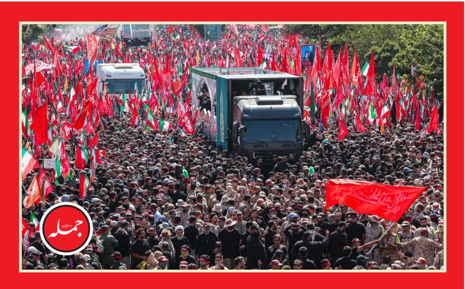
هنوز «همین یک جمله، شاید خلاصه تمام احساسات مردمی بود که امروز به خیابان آمده بودند.